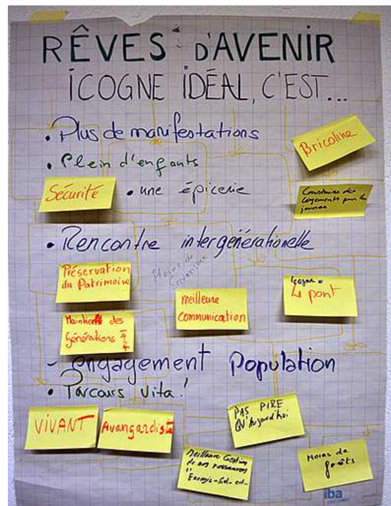
Petit compte-rendu de la soirée inter-commissions du 2 mars 2011