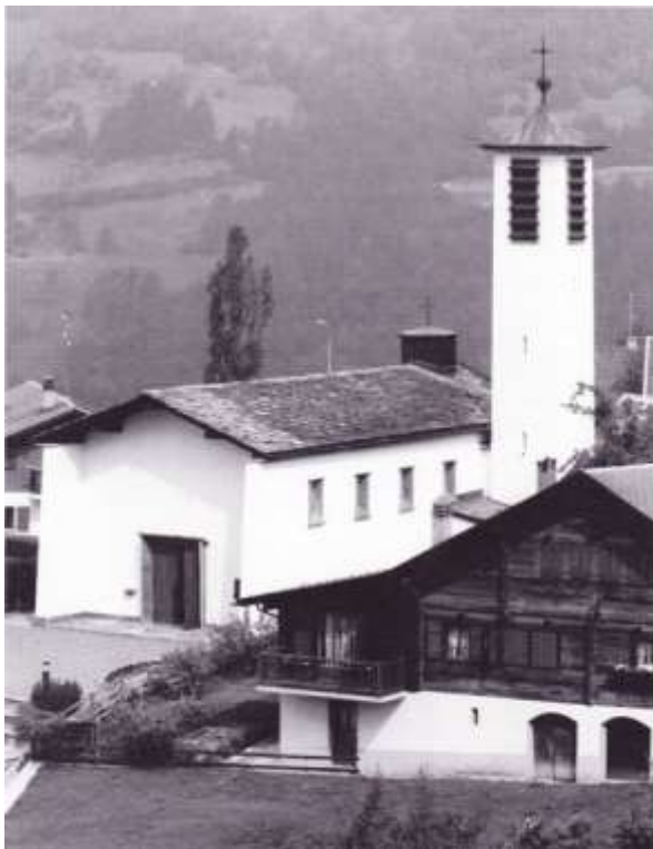
1La nouvelle Chapelle

Malgré quelques vellétés de changement, les autres présidents n'ont pas voulu rompre avec la tradition. Ce conseil «grand-bourgeoisial» a joué le rôle essentiel dans la naissance et le développement de la station de Crans-Montana. Aujourd'hui, on ne fait plus de distinction entre Grande Bourgeoisie, Grand Commun ou Grand Municipal, ces trois entités n'étant représentées que par un seul et même organisme. On peut noter d'autre part que des quatre communes de l'Ancien Lens, seule celle de Montana est encore gérée par deux conseils distincts, l'un municipal, l'autre bourgeoisial.