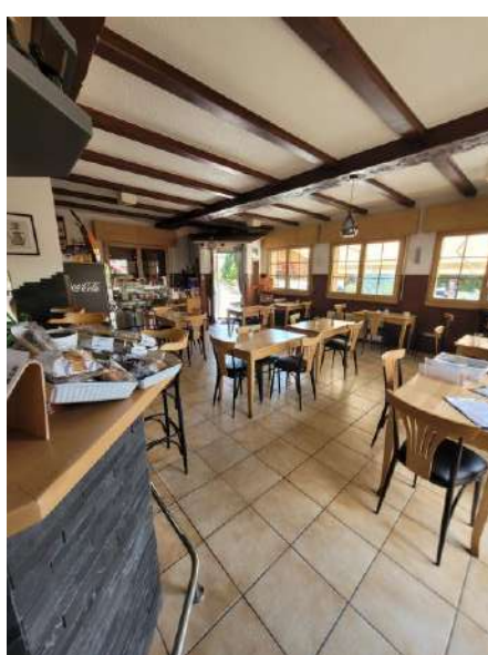
Salle à manger du café

Le bistro possède une cave grée de deux chambres froides, pour le stockage de nourriture sur place, d'une superficie totale de 25m 2 .