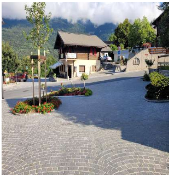
Jolie petite place en face du café