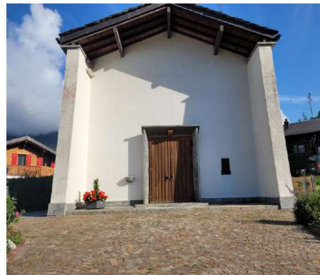
Façade de l'église du village