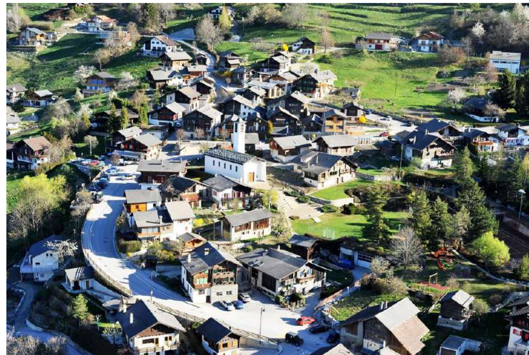
Photo aérienne du vieux village d'Icogne