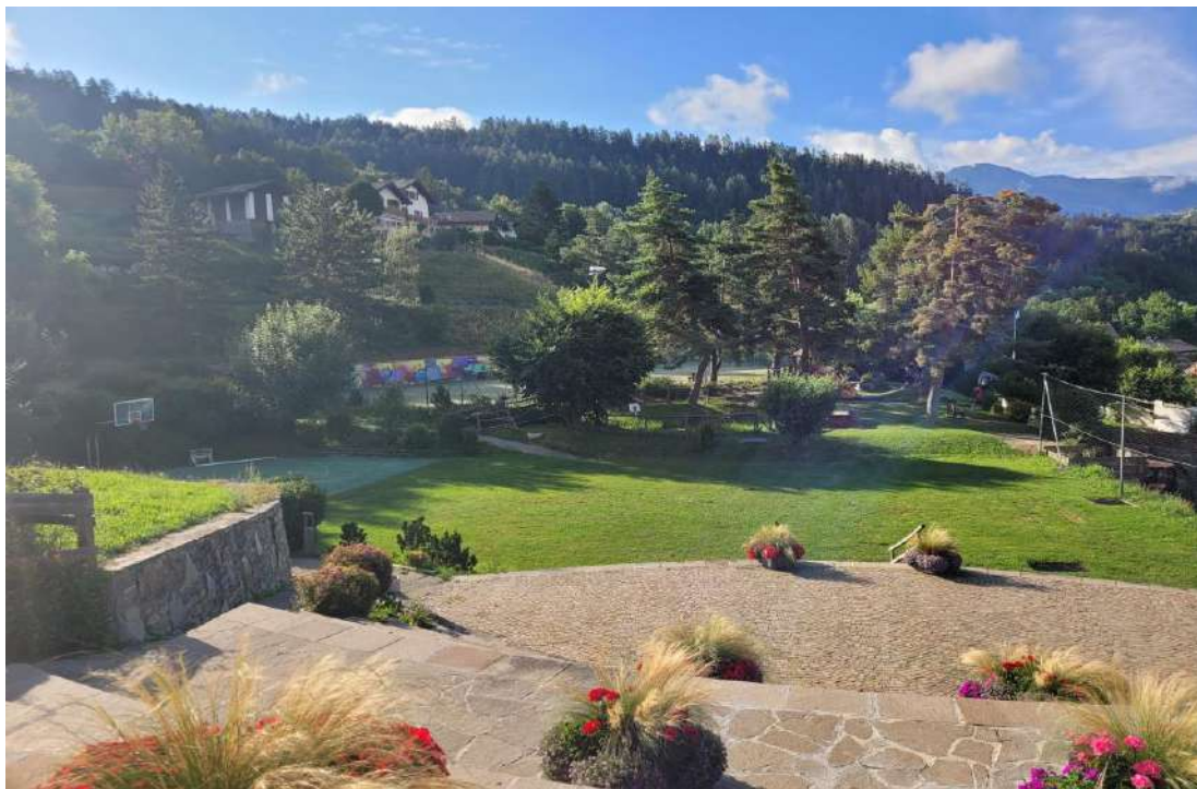
Centre du village comprenant une place de jeu, un terrain de tennis, un terrain de foot, un terrain de pétanque, un terrain de basket et de superbes décors floraux.