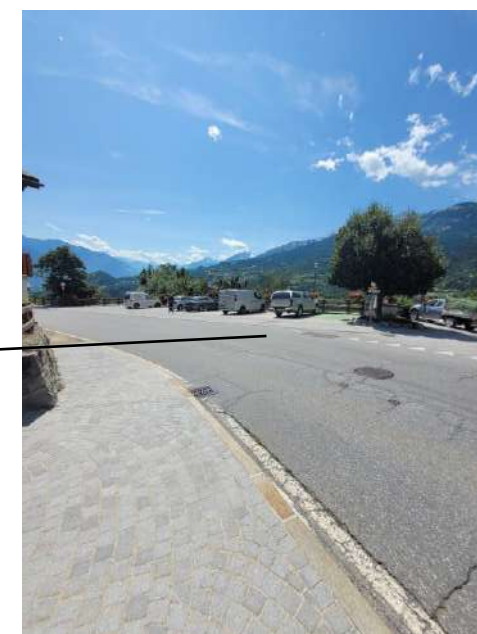
Parking du Pontet. 50m du café (1min à pied), capacité: 12 places + une recharge électrique