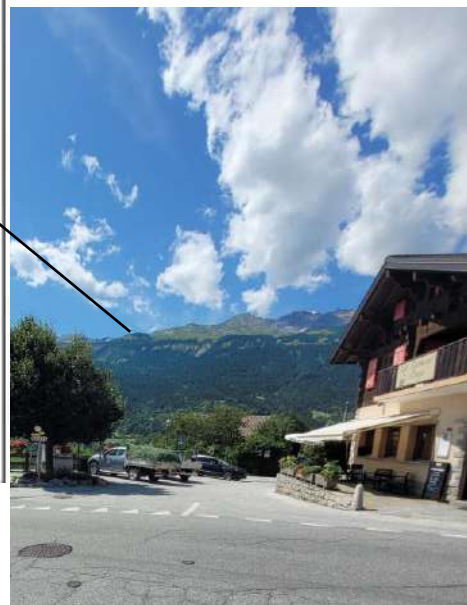
Parking devant le café. 10m du café, capacité: 5 places + 1 place handicapée

Vous pouvez retrouver cette image sur le site internet d'Icoigne, sous l'onglet parkings.