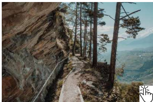
Grand Bisse de Lens