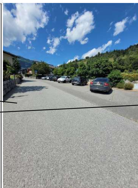
Parking du Cachiblio. 140m du café (2min à pied), capacité: 12 places + 1 place handicapée