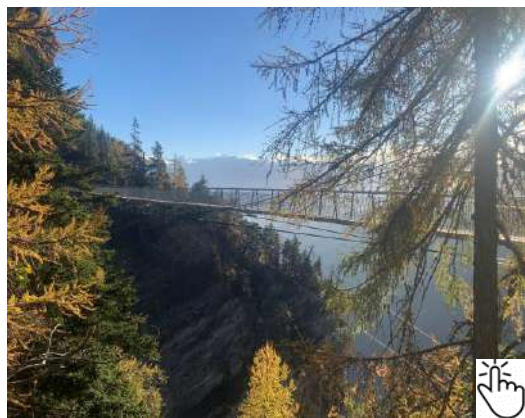
Passerelle du Bisse du Ro

Le Café d'Icogne, un lieu très convivial est situé au milieu d'un petit village aux airs ruraux. Très apprécié des touristes. Point fort de ce café ? Son emplacement. Placé sur l'axe «Crans-Montana – Lens – Sion», il est visible de tous et conquiert le cœur des marcheurs qui viennent en bus pour se balader dans l'un des nombreux bisses au départ d'Icogne. Comme le Bisse de Claveau, le Grand-Bisse de Lens ou encore le Bisse du Ro.