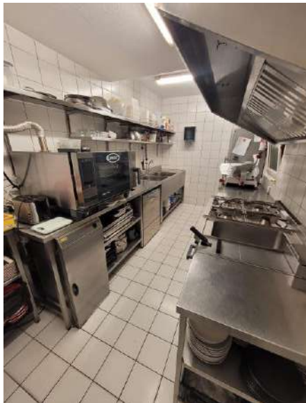
Cuisine, entièrement équipée